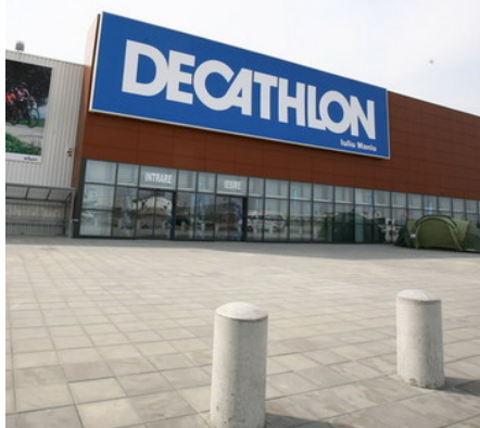
Декатлон Самара 440 т.