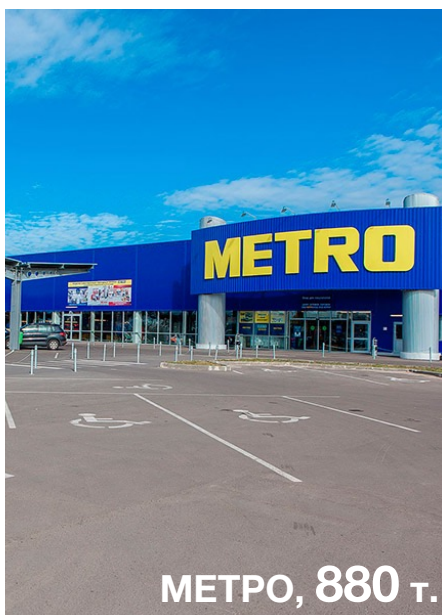
МЕТРО, 880 т.