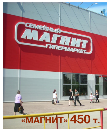
«МАГНИТ» 450 т.